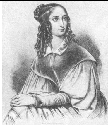
Flora Tristan 1