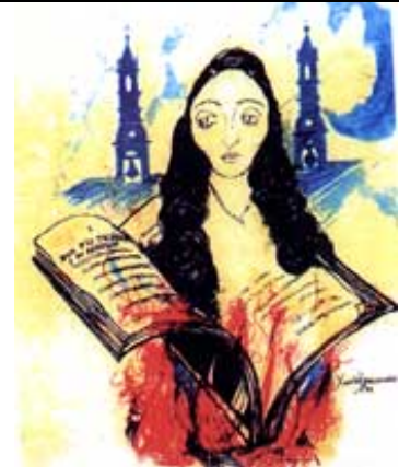
Flora Tristan 2