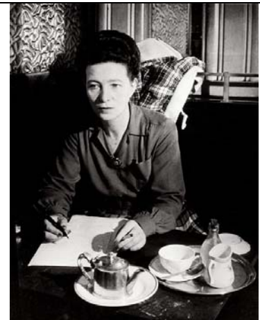
Simone de Beauvoir