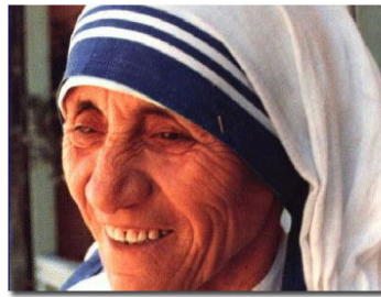
Teresa de Calcutta